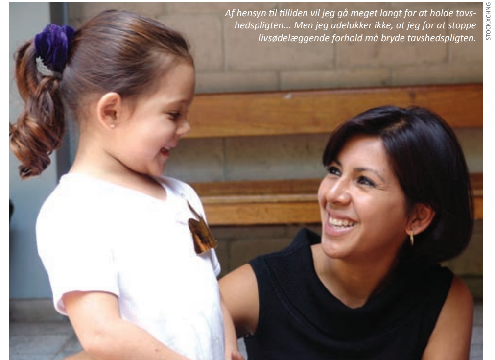
Af hensyn til tilliden vil jeg gå meget langt for at holde tavshedspligten... Men jeg udelukker ikke, at jeg for at stoppe livsødelæggende forhold må bryde tavshedspligten.

Øvreide, Haldor: Samtaler med barn – Metodiske samtaler med barn i vanskelige livssituasjoner . Høyskoleforlaget 2009.